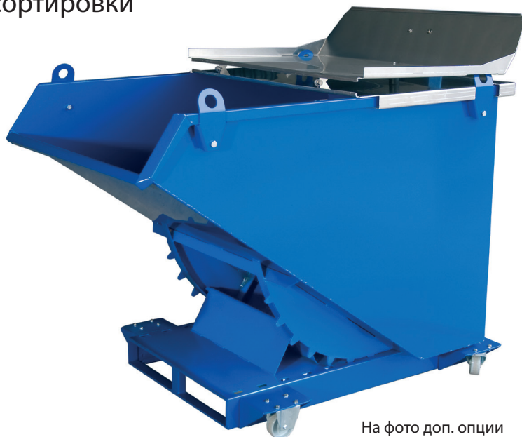
На фото доп. опции