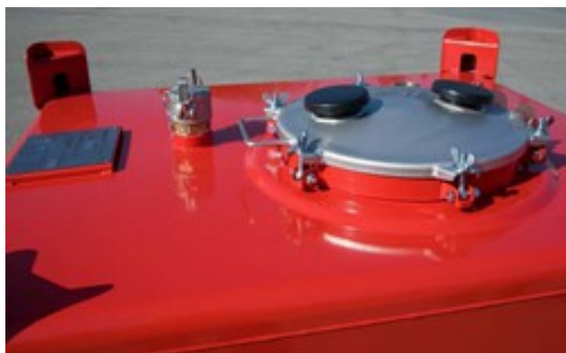
Соединения на поверхности.