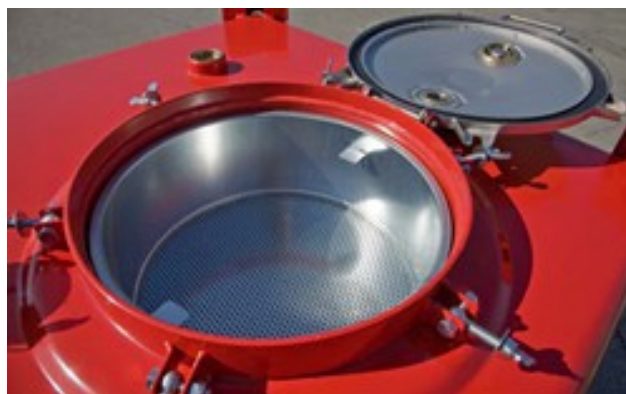
Сетчатый фильтр на входе, а также вакуумный клапан и сброса давления на крышке.